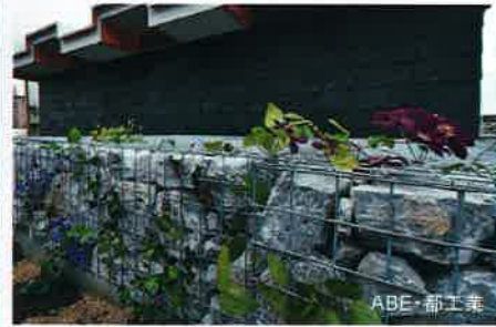
クールストーン・ロッカリー