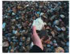
チャート石・碎石(小)

スコティッシュペブル(大) ホワイティペブル チャート石・碎石(小) クールストーン碎石(小)