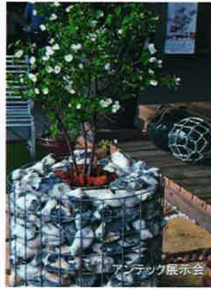
ジェットストーン