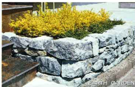
クールストーン・ロッカー