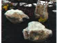
コッツウォールド・ボルダー

カナディアン・グレイ・バサルト・ホルダー コッツウォールド・ボルダー アルデンヌ・ボルダー 木曽石 高砂