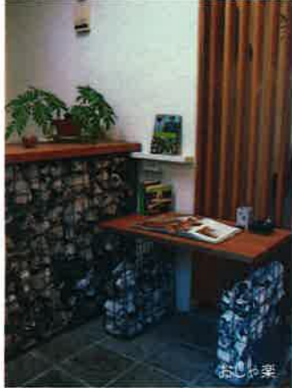
ジェットストーン