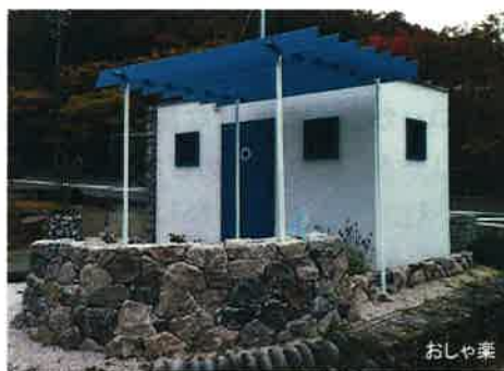
グレイスロッカー