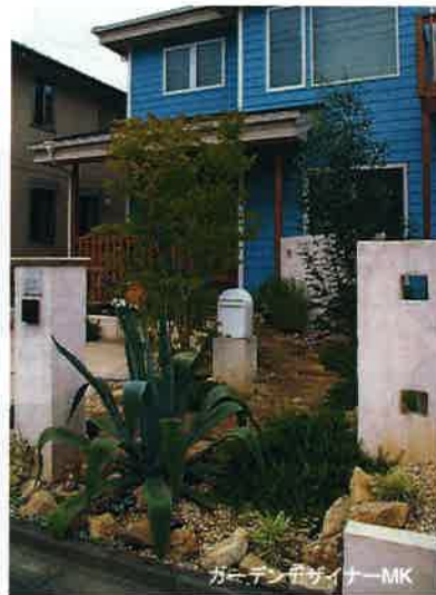
コッツウォールド・ロッカリー