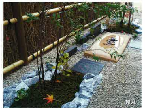
クールストーン・ロッカリー