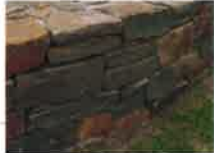
アルデンヌ・ウォーリング

カナディアン・グレイ・バサルト・ウォーリング アルデンヌ・ウォーリング コッツウォールド・ストーン 小丹波