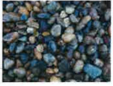
オールドリバーペブル

ゴールデンフリント オールドリバーペブル スコティッシュペブル(小) テムズベージュ スタッフオードシャープピンク