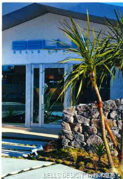
カナディアン・グレイ・パサルト・ロッカー